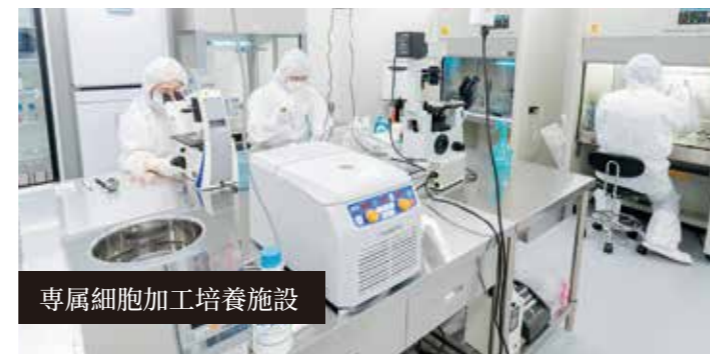
専属細胞加工培養施設