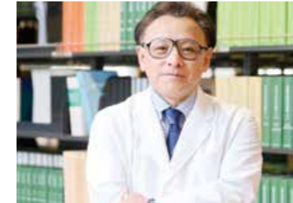
最高学術顧問 福沢 嘉孝 Yoshitaka Fukuzawa

慶應義塾大学呼吸器外科で肺がん治療研究を行い、川崎市立病院呼吸器科病院医長を歴任。外科専門医として多数の臨床経験を持ち、その後六本木ヒルズクリニック、SBI社が支援する会員制クリニックや米コロンビア大学の会員制クリニックの診察や立ち上げに参画。ヘルスケア関連では国立研究開発法人産業技術総合研究所でも従事。CLINIC 9ru、THE PREVENTION CLINIC TOKYO、BIOSTYLE CLINICで医療総監として先端医療に取り組み、信州大学特任教授として先鋭領域融合研究にも従事しています。帝京大学医学部卒業。