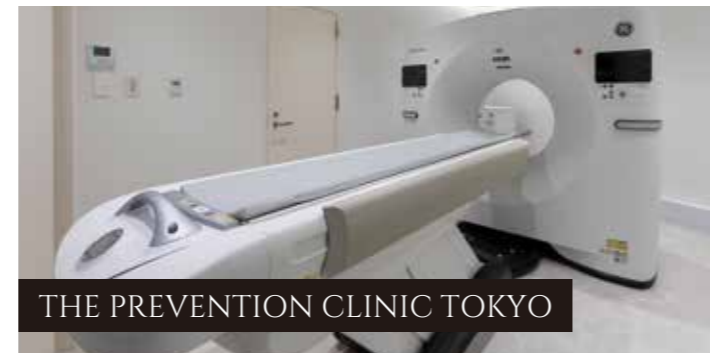
THE PREVENTION CLINIC TOKYO